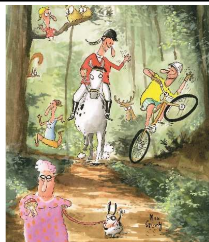
Les uns les autres nous nous respecterons.

Le petit guide est consultable et téléchargeable sur le site www.waldknigge.ch . Vous pouvez également le trouver à votre administration communale. Pour plus d'infos sur la forêt : www.foretsuisse.ch