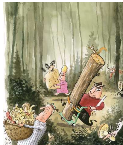
Fruits et récoltes, point nous n'amasserons.