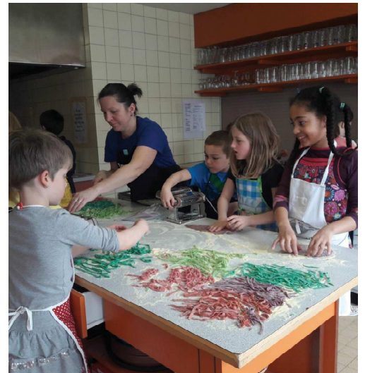
Confection de pâtes fraîches