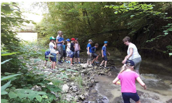
Les habitants de nos rivières