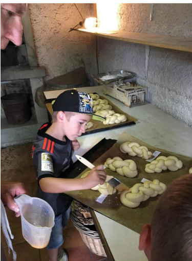
Four à pain