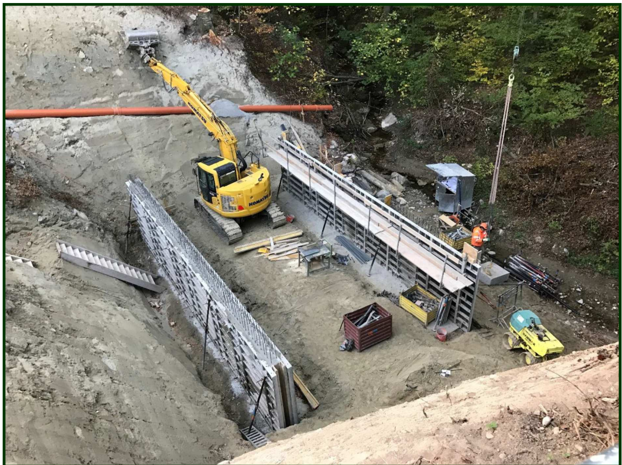
Chantier du Ruisseau du Bret