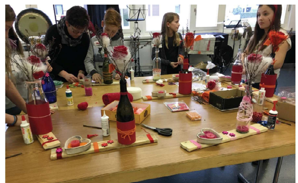
Atelier déco florale

12 nouvelles activités seront proposées gratuitement aux enfants du cercle scolaire de Châtonnaye-Torny dès le mois de janvier.