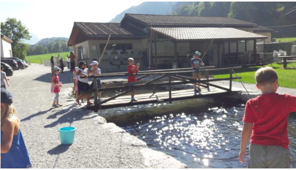
Pêche et grillades