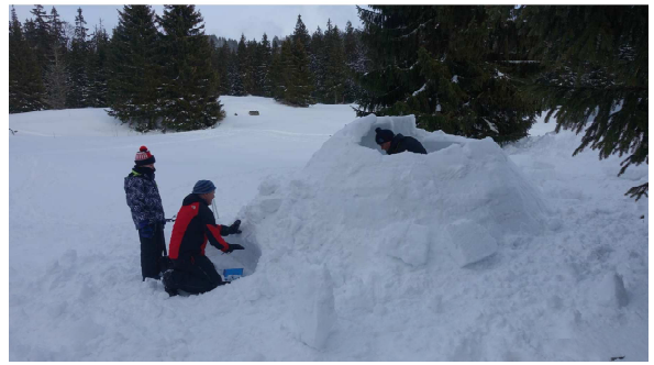
Week-end dans un igloo