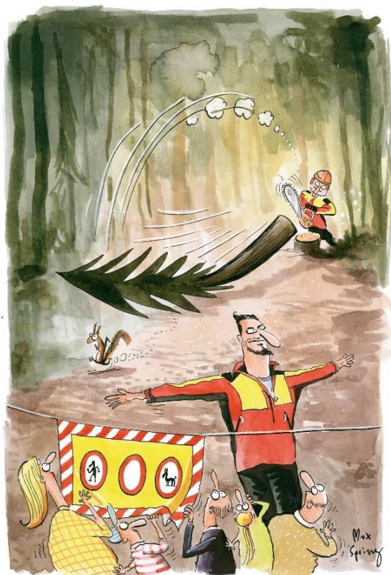
Illustration: Max Spring in Savoir-vivre en forêt de